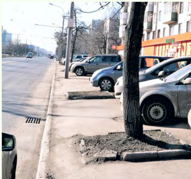
■ Содержание приствольных кругов деревьев на улицах Берлина (слева) и Москвы. Почувствуйте разницу!

Контроль за соблюдением правил парковки будет осуществлять Объединение административно-технических инспекций (ОАТИ).