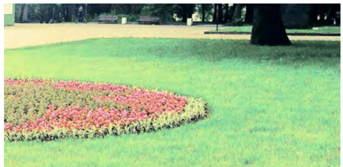
«Партерный» газон в Измайловском парке

В «Энциклопедии ремонта и дизайна» о партерном газоне написано следующее: «Среди всех видов газонов партерный — самый эффектный. Идеально ровная изумрудная поляна, покрытая густой, нежной, коротко стриженной зеленью, роскошной как персидский ковёр, — таков «зелёный партер», настоящее произведение искусства». Но прежде чем уничтожить старый разнотравный лужок на своём участке, подумайте о трудностях, с которыми вам придётся столкнуться. Этот тип газона считается наиболее дорогим и капризным. В условиях средней полосы России, Москвы и Подмосковья создание полноценного партерного газона — задача крайне сложная и почти невыполнимая.