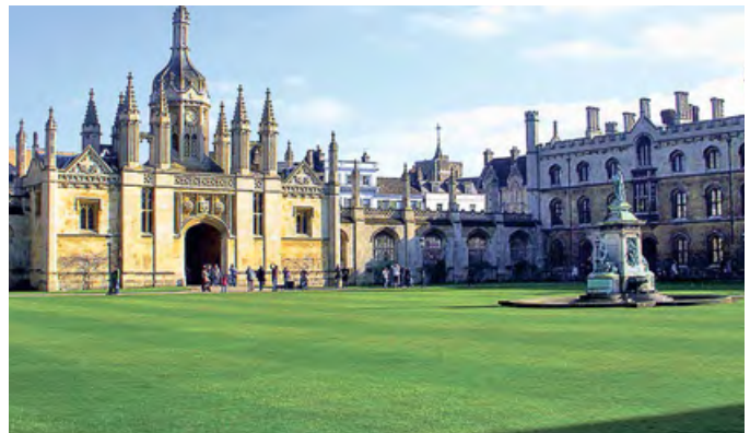
Королевский колледж в Кембридже

На значимых площадях, возле памятника какому-нибудь деятелю, в усадьбах XVII–XIX веков — памятниках садово-паркового искусства, в загородных домах знаменитостей и миллиардеров. Только в городских условиях Москвы вряд ли кто-то сможет найти идеальный партерный газон, ибо после всех мероприятий по «благоустройству» города, проводимых за сумасшедшие деньги, все бывшие партерные газоны теперь скорее ближе к типу «газон обыкновенный». Посмотрите на фото и почувствуйте разницу.